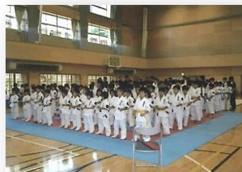
最近のキッズ大会。ようやく大会らしくなってきた。