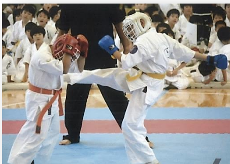
つらさに堪えて、倦まず弛まず努力する。

このような賞を授与することで、痛みやつらさに堪えて、倦まず弛まず努力することの大切さを教えているわけです。