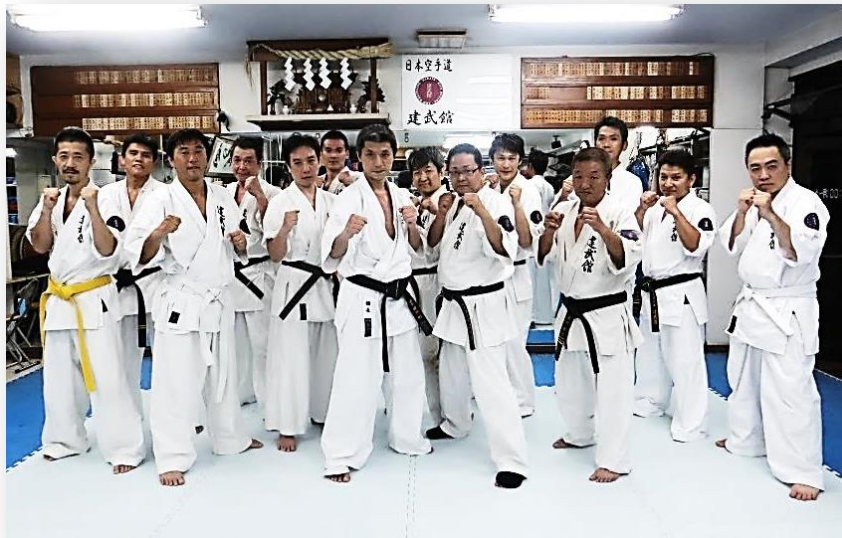
組手でヒヒヒ言ってたけれどカメラの前ではカッコよく！

親があれこれ言うばかりでなく頑張る姿を見せようぜ —— ということで空手を習っている子のお父さんたちが集まって“おやじの会”を作りました。やはり、親という草の根から理解してもらうことが大事なのだといつも思っています。