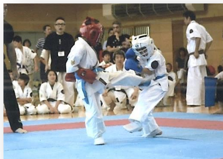
直接打撃の相手は痛くて怖い。しかし怖いながらも立ち向かう。

試合は直接打撃の相手だけに痛くて怖いものです。それに、負けたら恥ずかしいものですから、気の弱い子は出場をためらいます。ですが、試合においては、勝ち負けの結果よりも“勝ち方や負け方”がとても大切で、負けた時の身の処し方や悔しいけれど負けを潔く認める心の広さを学ばせるチャンスなので「勝っても負けても勉強だ。負けて勉強になることもある」そう言って出させています。大事なことは強そうな相手にも、怖いながら立ち向かったということです。負けるのがイヤと尻込みせず、にやるだけやってみると、背中を押しているわけなのです。